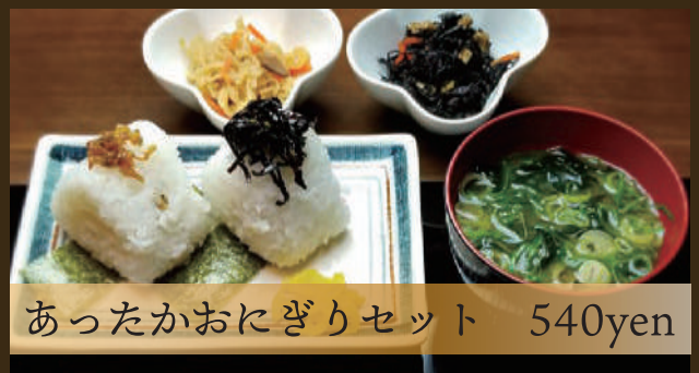
あったかおにぎりセット 540yen