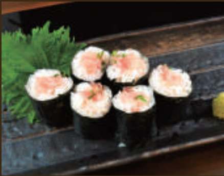
まぐろネギトロ細巻き 450yen