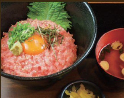
まぐろネギトロ丼 1,080yen みそ汁・漬物付き