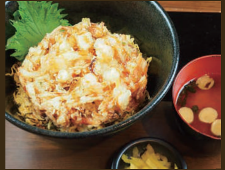
サクサク ジャンボかき揚げ丼 880yen みそ汁・漬物付き