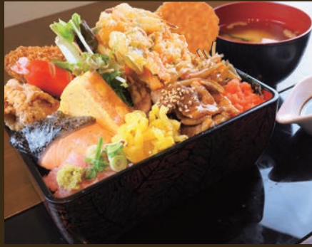
海賊王の極のり弁重(みそ汁付) 1,200yen コロッケ・野菜かき揚げ・漁火アジフライ・鮭・ 赤ウィンナー・まぐろねぎとろ・たくあん・明太子・ 豚しょうが焼き・卵焼き・若鶏の唐揚げ・きんぴらごぼう