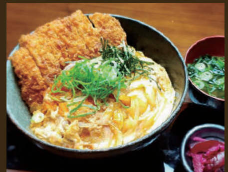
かつ丼 1,180yen みそ汁・漬物付き