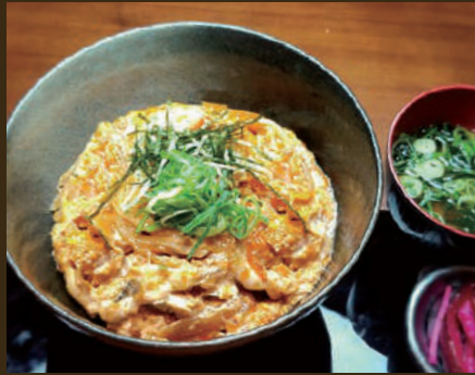
玉子丼 600yen みそ汁・漬物付き