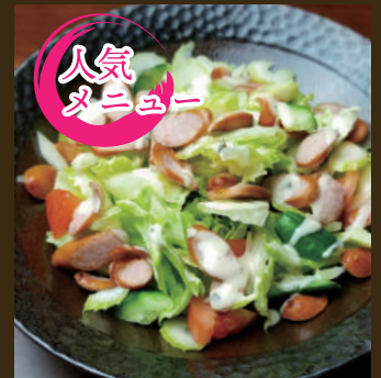
西宮サラダ 750yen ハーフ 450yen