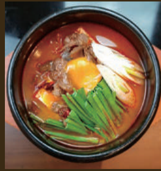
牛すじスンドゥブ 1,380yen

スンドゥブ定食 〔韓国のみ・ごはん・漬物〕 +200yen トッピング 豚 150yen ホルモン 450yen 牛すじ 450yen *同時にご注文ください。 後からの追加はできません。