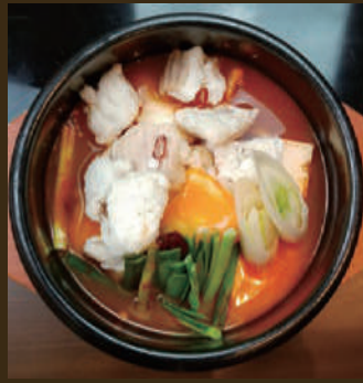
牛ホルモンスンドゥブ 1,380yen