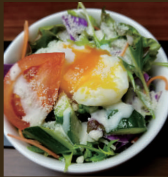
チーズたっぷり シーザーサラダ 450yen