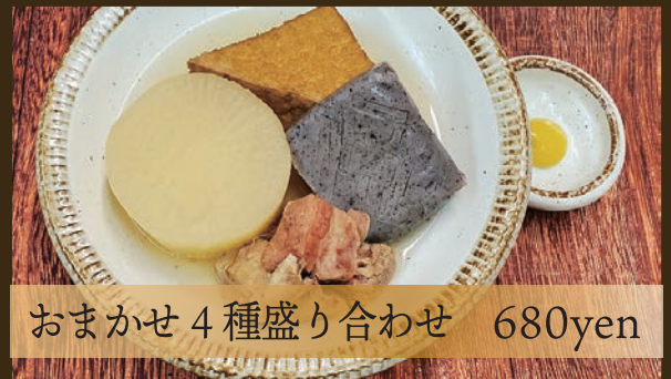
おまかせ4種盛り合わせ 680yen