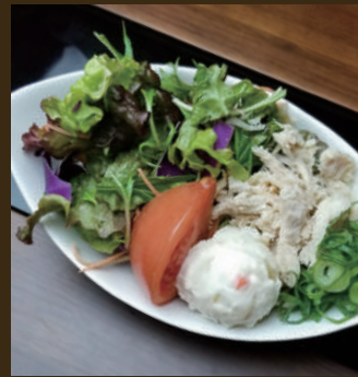
蒸し鶏のごまサラダ 500yen