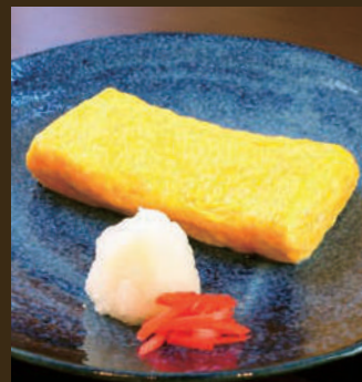
こだわり卵のだし巻き 500yen