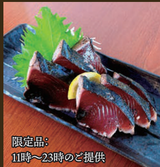
静岡県産 かつおのたたき 5切 680yen 3切 480yen