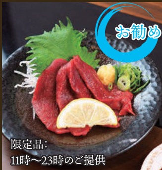
熊本名産 スタミナ馬刺し 600yen

スンドゥブ定食 〔韓国のみ・ごはん・漬物〕 +200yen トッピング 豚 150yen ホルモン 450yen 牛すじ 450yen *同時にご注文ください。 後からの追加はできません。