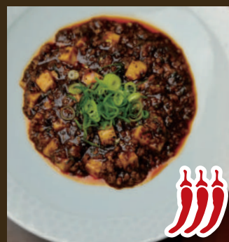
四川風 麻婆豆腐 980yen