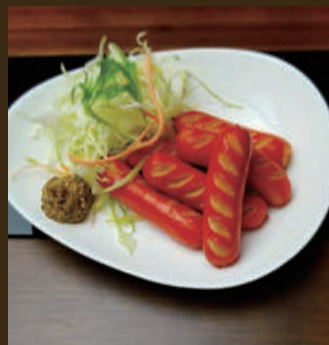
昔なつかし赤ウインナー 400yen