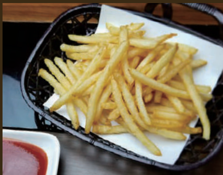
カリカリポテトフライ 400yen