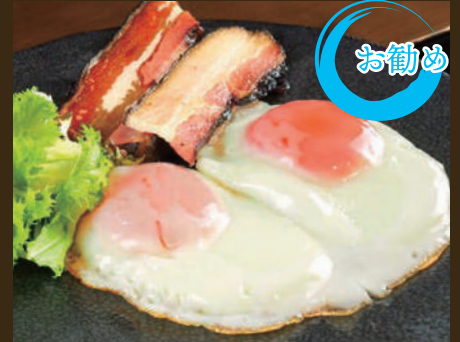
ベーコンエッグ 特製スパイス 540yen