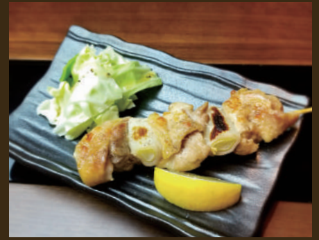
ジャンボ焼き鳥 (塩) 400yen