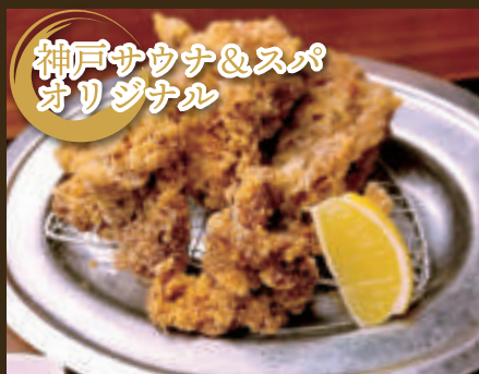
若鶏の唐揚げ 5個 680yen 3個 530yen