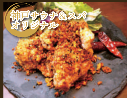
やみつき スパイシー揚げ鶏 680yen