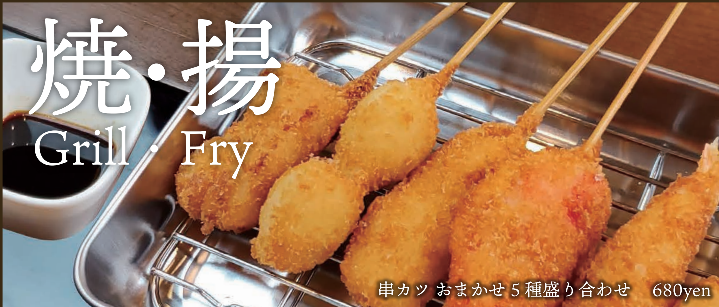
串カツ おまかせ 5種盛り合わせ 680yen