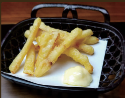
さきいかの天ぷら 450yen