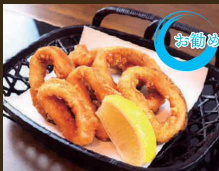
やわらかイカ唐揚げ 540yen