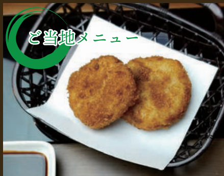
神戸菊水 ぼっかけコロケ 450yen