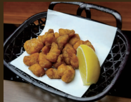
鶏なんこつの唐揚げ 400yen