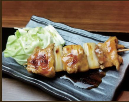
ジャンボ焼き鳥 (たれ) 400yen