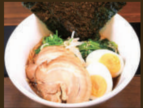
昔ながらの中華らーめん ~しょうゆ~ 980yen