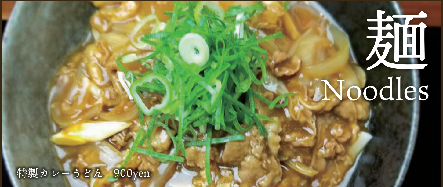
特製カレーうどん 900yen