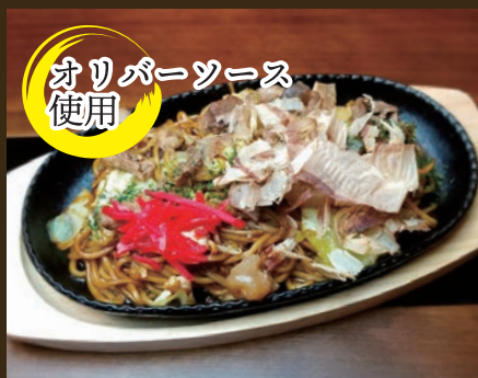
ぼっかけ焼きそば 980yen