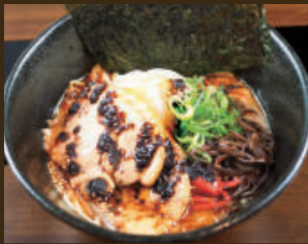
熊本らーめん ~こがしにんにく~ 980yen