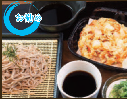
サクサクジャンボかき揚げ天ざるそば