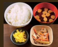
ごはんセット ごはん・小鉢・みそ汁・漬物 310yen