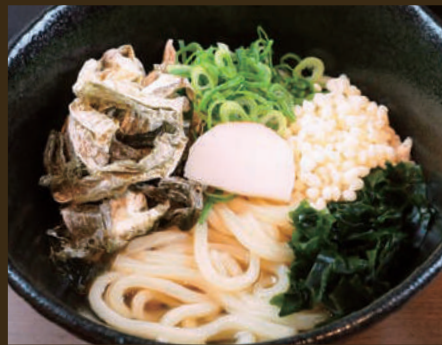
おぼろこんぶうどん