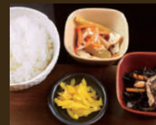
おかずセット ごはん・小鉢2品・漬物 310yen