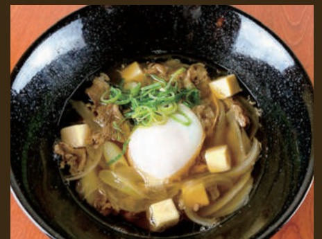
伝説の肉吸い (肉うどんのうどん抜き)