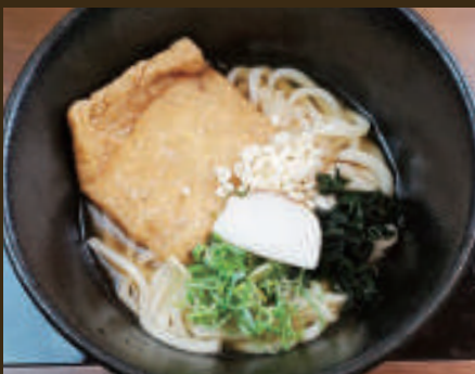
ふっくらおあげのきつねうどん