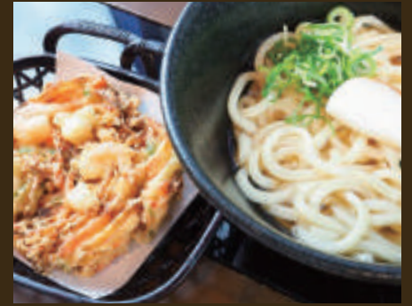
別盛りサクサクジャンボかき揚げうどん