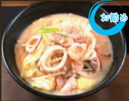
海鮮チャンポンらーめん (イカ・エビ・タコ) 1,180yen